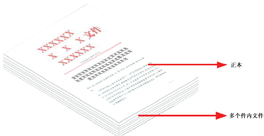
图 E.1 电子档案表现形式示意图

以发文为例,包含多个件内文件(正本、文件处理单、定稿、历次修改稿等)的电子档案可合并成一个 OFD 文件,其呈现形式,见图 E.1。